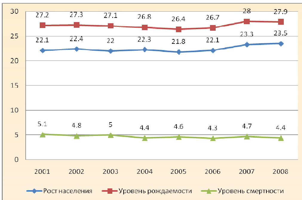
Рост населения, уровень рождаемости и смертности в Таджикистане (на 1000 населения) 20 :